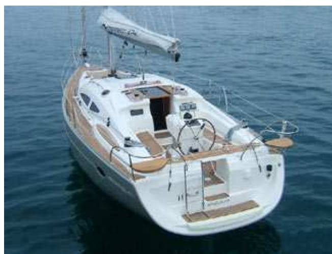
Elan 38.4 Impression